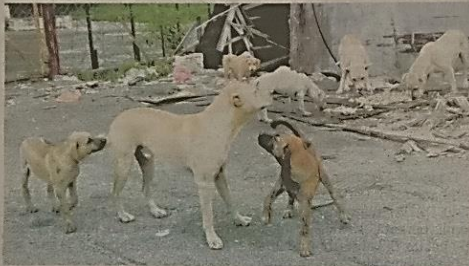
BEBERAPA ekor anjing berkeliraran di Taman Jasmin, Kajang kelmarin.

"Anjing-anjing ini 'cerdik' kerana akan lari bersembunyi apabila MPKJ datang. Penduduk tidak berani ambil tindakan sendiri kerana khuatir dikenakan tindakan