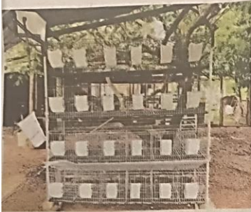
NETSBOX untuk kemudahan ibu arnab menjaga dan menyusukan anak baru lahir.