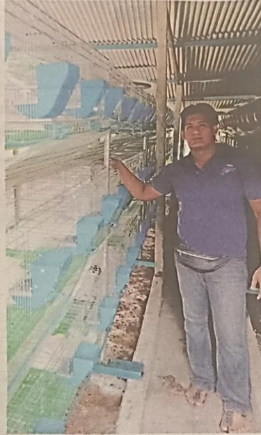
SANGKAR yang dijual kepada orang ramai.

Waktu makannya juga berbeza daripada haiwan ternakan lain iaitu hanya bermula pada sebelah petang hingga ke malam ketika cuaca tidak panas